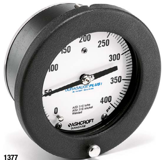
1377 Nenngröße 4 ½" (115 mm)